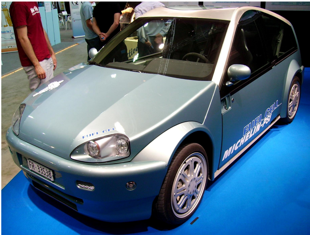
Prototype Michelin d'une voiture électrique légère dont les roues intègrent 4 moteurs électriques (Energissima 07).

Pour les trajets courts et dans les zones urbaines, l'électricité semble tout indiquée: silence, aucune émission de CO 2 , ce type de véhicule a un bel avenir pour autant qu'il soit petit, léger et facile à recharger. Là encore, il sera fondamental de produire cette électricité à partir des ressources locales et renouvelables directement dans les quartiers de résidence.