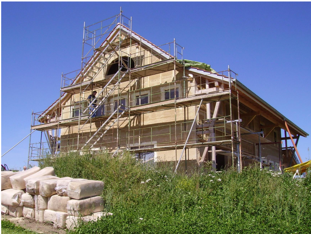
Ferme réalisée en chanvre banché par « Pittet Artisan ».