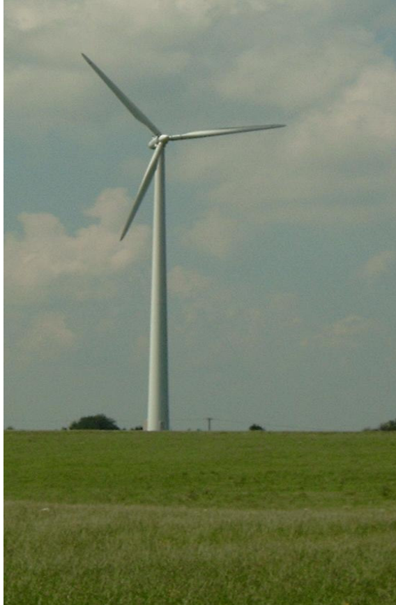
Eolienne le long d'une piste cyclable touristique en Bavière.

pour autant qu'il n'y ait pas d'augmentation de la demande.