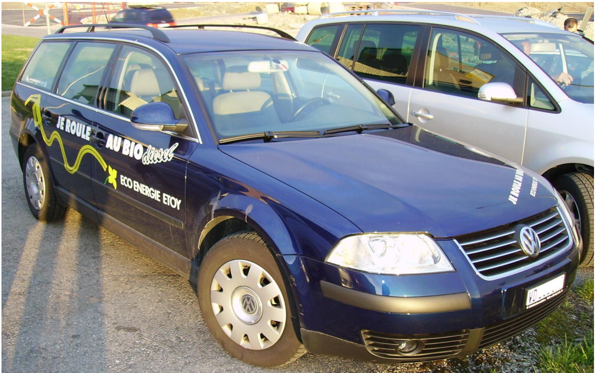
Voiture contemporaine fonctionnant 100% au bio diesel.

Ferroutage et transport fluvial ne représentent qu'une faible part du déplacement de fret; les camions n'ont pour le moment pas de concurrents