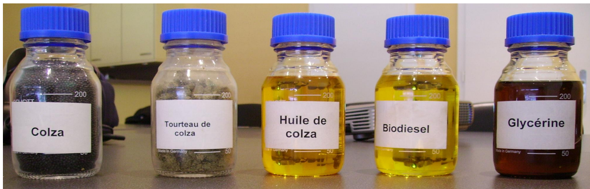
Différents éléments du colza au bio diesel produits sur le site d'Etoy ; il faut 3 tonnes de colza pour produire 1000l de bio diesel.

Cette technologie ne sera hélas pas opérationnelle avant une vingtaine d'années encore. Pour le moment aucune intention n'est manifestée par les autorités pour favoriser cette recherche, hormis dans quelques cas comme l'Islande ou la Californie. Des applications militaires, notamment des sous-marins, fonctionnent déjà avec des piles à combustible.