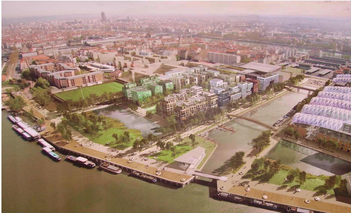
Projet d'éco quartier à Lyon (photos du panneau explicatif présenté au salon Energissima 07).

Le 3 octobre dernier, la Russie a usé une nouvelle fois de la coupure de son oléoduc pour exercer une pression politique sur l'Ukraine. Comme 80% de l'approvisionnement énergétique européen venant de Russie transite par ce pays, la diplomatie européenne se montre bien aimable avec Moscou. Elle attend impatiemment la construction de deux nouveaux oléoducs qui approvisionneront l'Europe directement par la mer du Nord et la mer Noire. A cette perpétuelle incertitude politique, s'ajoute l'épuisement inéluctable des énergies fossiles qui interviendra, estime-t-on, au plus tard d'ici une quarantaine d'années pour le pétrole et une soixantaine d'années pour le gaz. Si le prix de ces énergies ne peut que grimper, c'est davantage en raison de l'augmentation quotidienne de la demande que de la future pénurie. On estime aujourd'hui que la Chine consommera le tiers des ressources énergétiques disponibles à l'horizon 2020-2030. Ainsi, la construction d'un nouvel oléoduc entre la Russie et la Chine est un facteur potentiel d'augmentation des prix du marché des hydrocarbures bien plus préoccupant que l'épuisement des réserves.