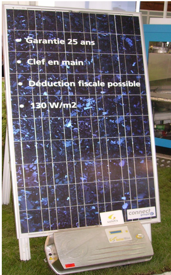
Cellules photovoltaïques: « 130W/m2, garantie 25 ans ».

La diversité du bouquet énergétique est un enjeu majeur. Aujourd'hui, les producteurs d'énergie sont puissants et influents et il n'est nullement dans leur intérêt de voir s'effondrer la structure pyramidale qui caractérise leur secteur au profit d'une multiplication des producteurs, des sources et types d'énergie. Et pourtant, c'est la seule alternative crédible pour pallier les manques à venir. En modifiant la structure du marché de l'énergie, un éclatement et l'apparition d'une